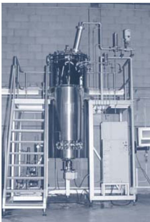
1500 liter bioreactor ATO

In 2001 werden diverse van de oorspronkelijk 22 projecten gedesinvesteerd. Dit betreft projecten die contractueel aflopen in 2000/2001 (10). Van een aantal daarvan stellen de projectleiders dat de apparatuur niet meer kan worden ingezet voor commerciële taken, meestal vanwege veroudering van de soort apparatuur. In één geval, de PK3 faciliteit in Amsterdam is deze afgeschreven omdat de industriële belangstelling tot 0 gedaald is dankzij het restrictieve beleid t.o.v. plantenbiotechnologie. In één project zijn meerdere apparaten bij verschillende instellingen geplaatst, hiervan werden er 2 als te oud aangemerkt en gedesinvesteerd. In alle andere gevallen hebben de projectleiders aangegeven nog wel gebruik te maken van de apparatuur c.q. ruimten en zich gecommitteerd een minimum bedrag per jaar te blijven betalen. Deze apparaten worden wel overgedragen, maar blijven op de lijst van mibiton-faciliteiten staan en zijn commercieel te gebruiken. Inclusief deze extra bijdragen werd € 325.142 terugbetaald. Er werd uit het revolving fund € 362.598 bijgedragen aan de investeringen van BPFs. Ook hier waren nog extra inkomsten van € 7591. De rente-inkomsten bedroegen € 142.503.